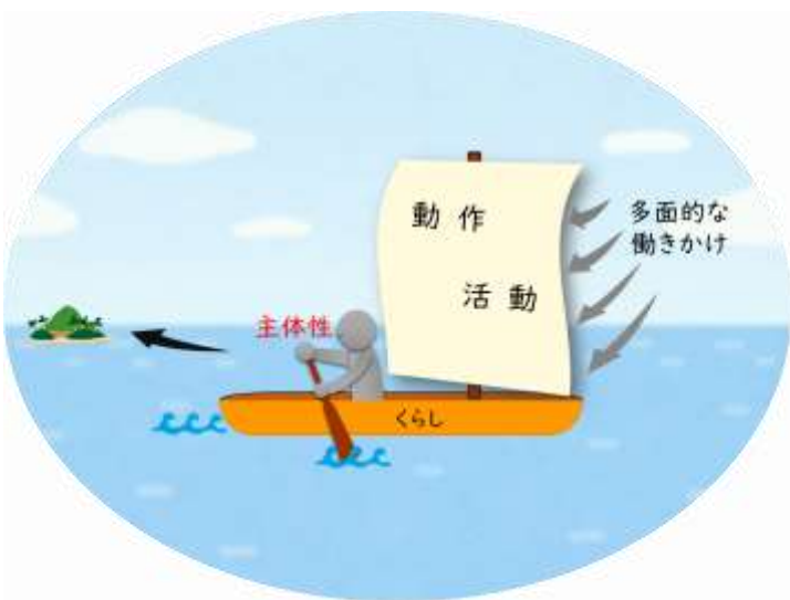
地域理学療法学のイメージ図

地域理学療法学とは、動作や活動への多面的な働きかけにより人々が地域でのくらしを主体的につくりあげられるよう探究する学問。