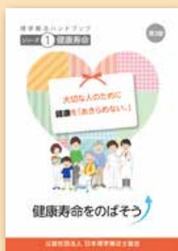
シリーズ① 健康寿命