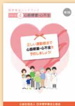
シリーズ④ 心筋梗塞・心不全