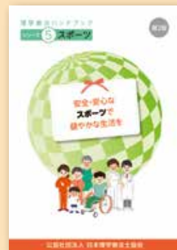
シリーズ⑤ スポーツ