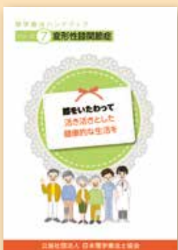
シリーズ⑦ 変形性関節症