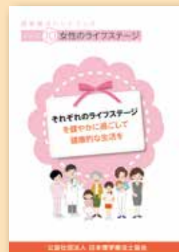
シリーズ⑩ 女性の ライフステージ